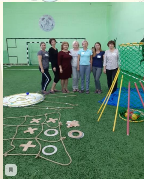
Фестиваль напольных игр «В мире детства»